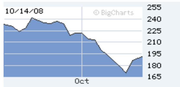
DJ World Index (1 mes)

Los mercados bursátiles globales rebotaron el lunes, tras una semana catalogada como la peor de la historia, luego de que países de todo el mundo encabezados por Gran Bretaña prometieron entregar efectivo a sus bancos para apuntalar al debilitado sistema financiero. De esta manera los mercados toman un respiro después de dos semanas de fuertes pérdidas.